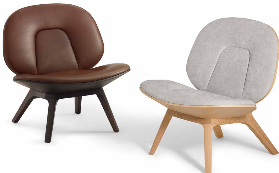
Fauteuil in Eiche EI204 Mokka, Anilina hasel Fauteuil in Eiche EI200 Sand, Maple chalk