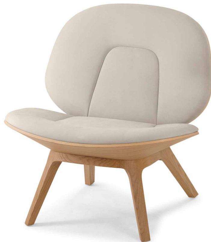
Fauteuil in Eiche EI200 Sand, Velluto ivory