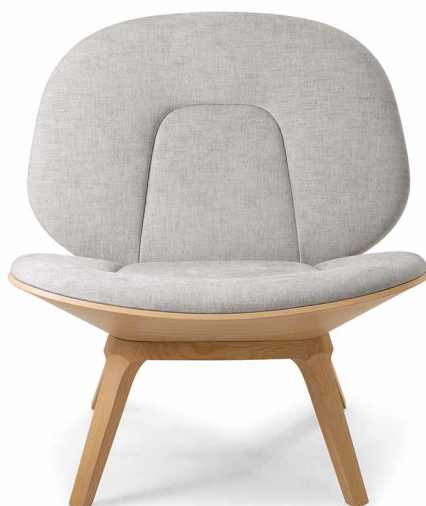
Fauteuil in Eiche EI200 Sand, Maple chalk